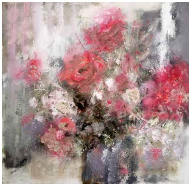
No. 19'303, Öl auf Leinwand, rückseitig signiert, 60 x 60 cm, 2016