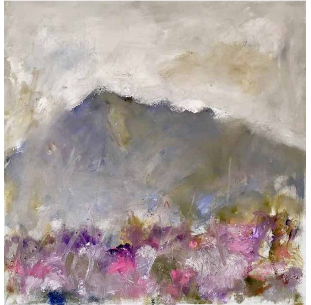
No. 20'079 „Niesen“, Öl auf Leinwand, rückseitig signiert, 60 x 60 cm, aus der Werkgruppe „préalpes“, 2016