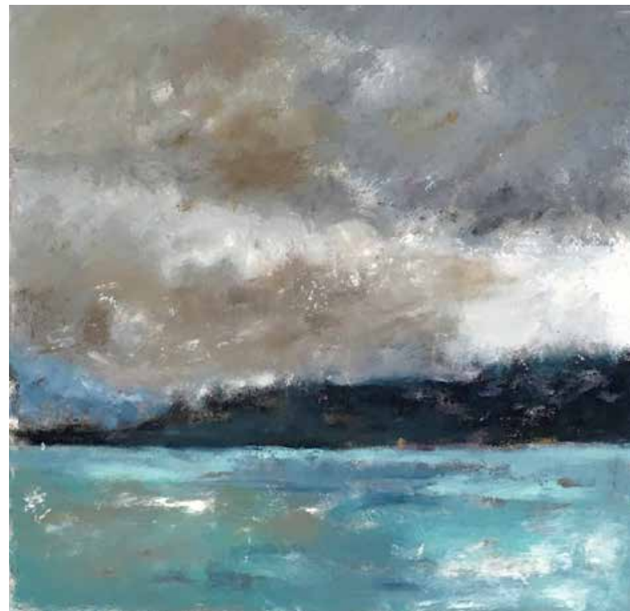
No. 19'418, Öl auf Leinwand, rückseitig signiert, 70 x 70 cm, aus der Werkgruppe „See“, 2016