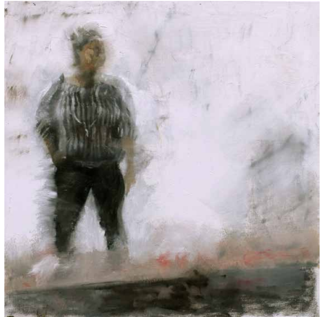
No. 19'676, Öl auf Leinwand, rückseitig signiert, 90 x 90 cm, 2015