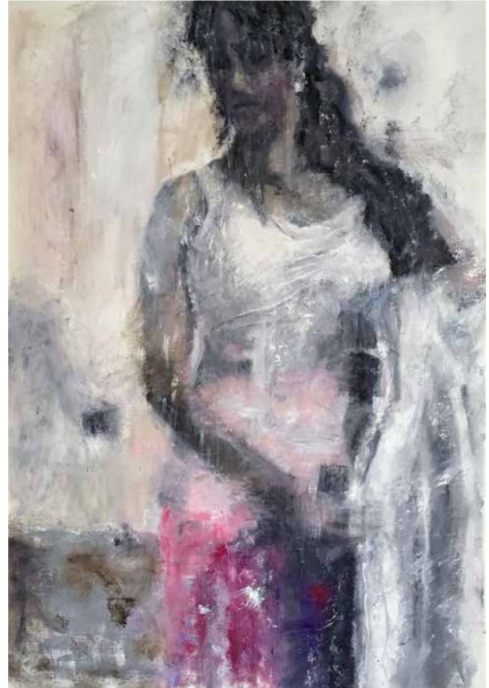
No. 20'011, Öl auf Leinwand, rückseitig signiert, 100 x 70 cm, aus der Werkgruppe „Diva“, 2016