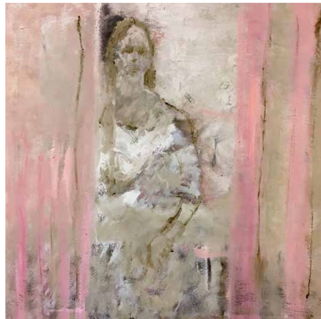
No. 20'047, Öl auf Leinwand, rückseitig signiert, 70 x 70 cm, aus der Werkgruppe „Diva“, 2016