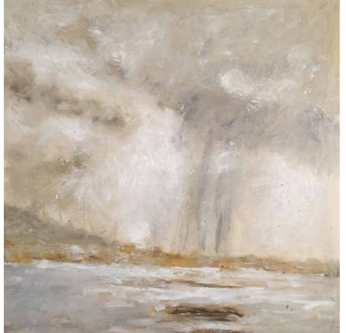
No. 20'039, Öl auf Leinwand, rückseitig signiert, 80 x 80 cm, aus der Werkgruppe „See“, 2016