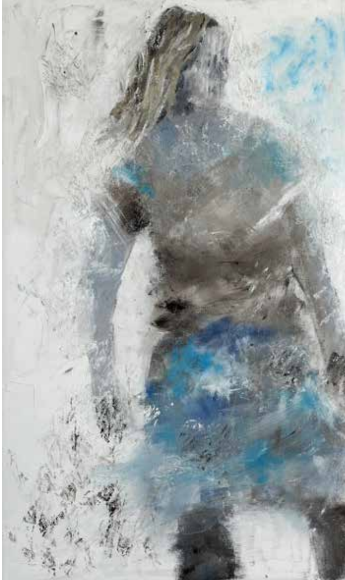
No. 19'594, Öl auf Leinwand, rückseitig signiert, 50 x 30 cm, 2015