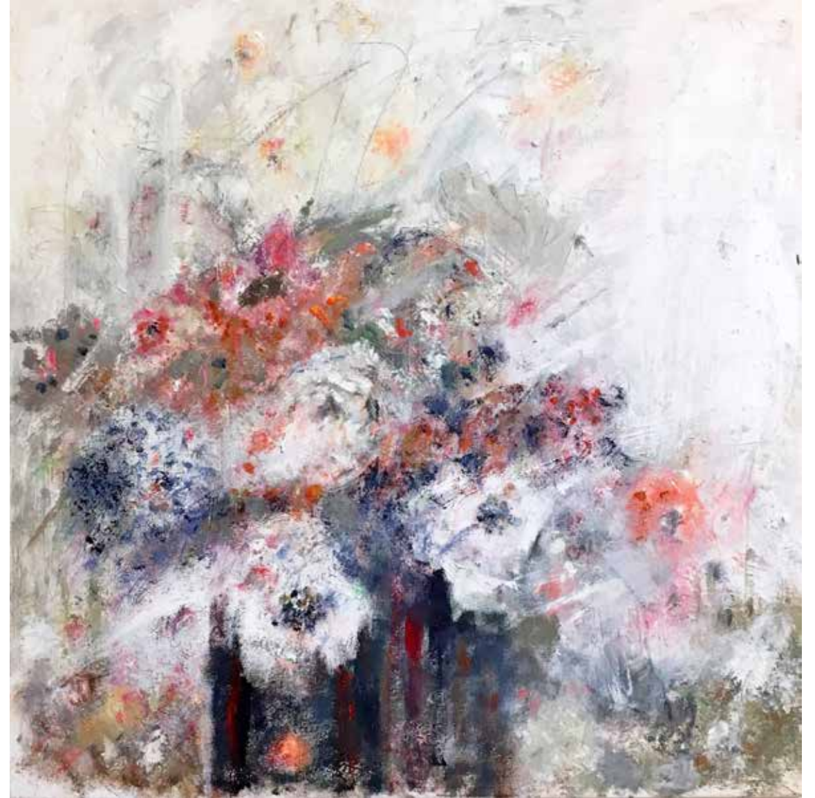
No. 19'846, Öl auf Leinwand, rückseitig signiert, 100 x 100 cm, 2016