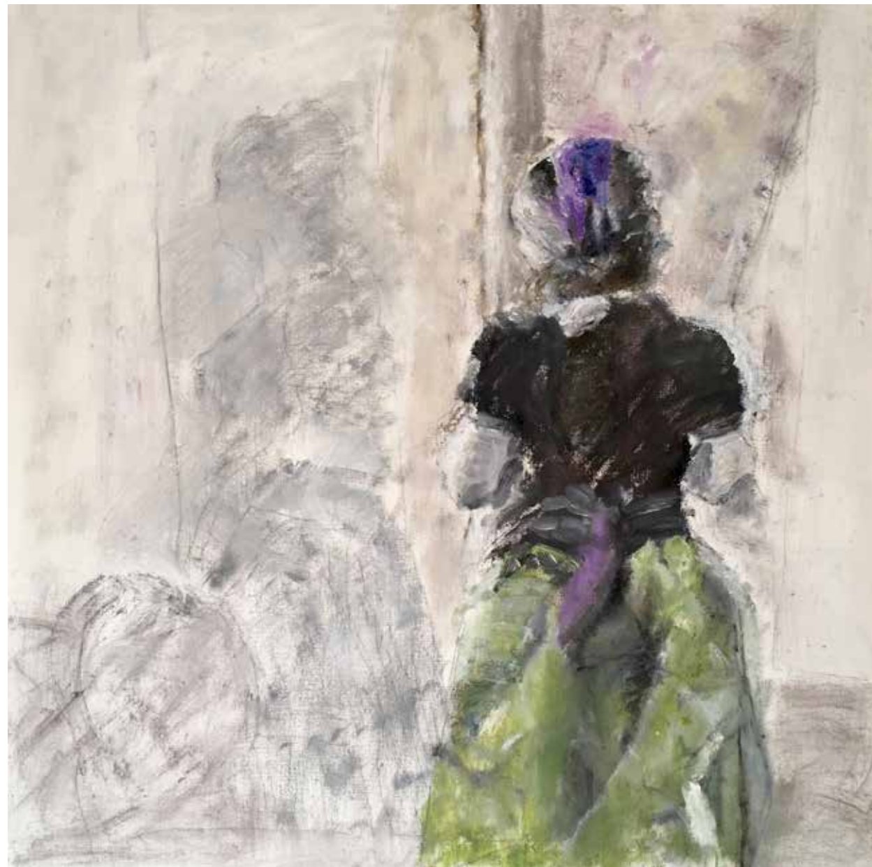
No. 20'062, Öl auf Leinwand, rückseitig signiert, 90 x 90 cm, aus der Werkgruppe „Diva“, 2016