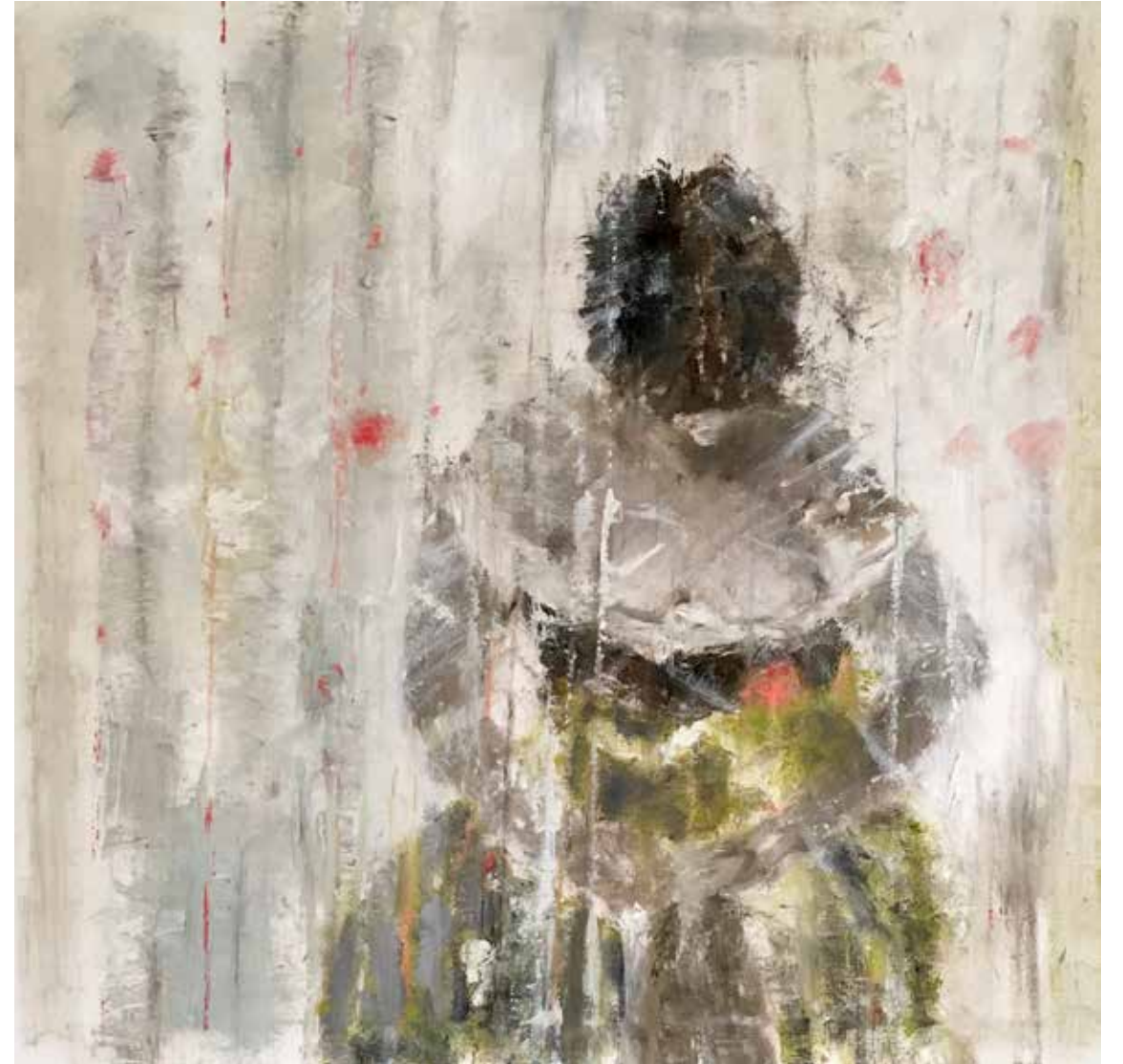
No. 20'157, Öl auf Leinwand, rückseitig signiert, 80 x 80 cm, aus der Werkgruppe „Diva“, 2017