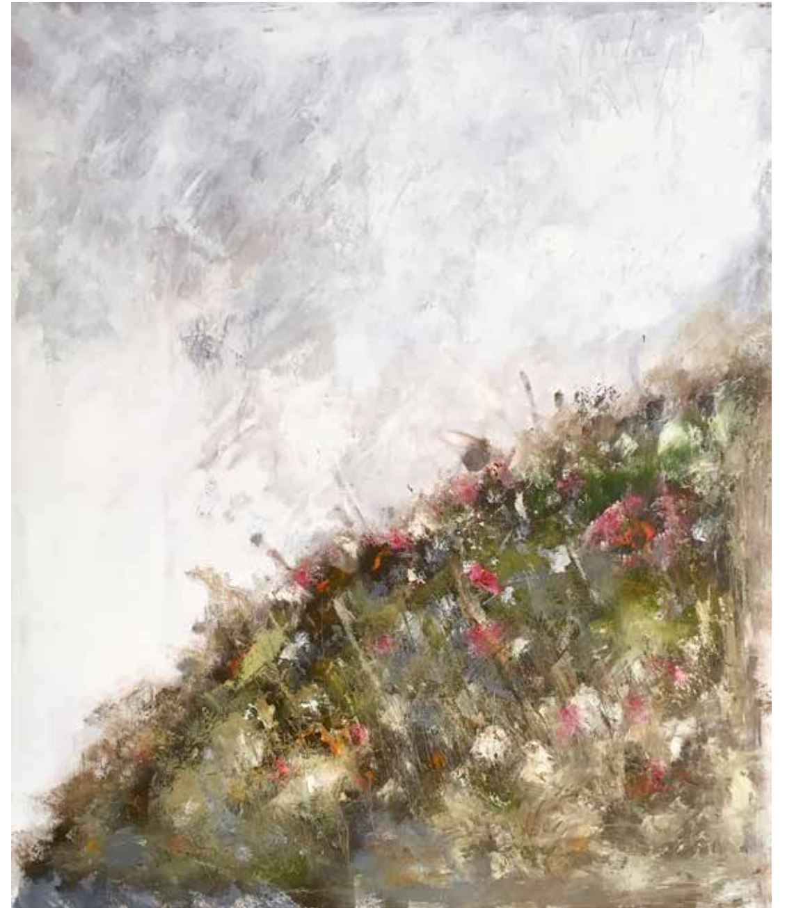
No. 19'571, Öl auf Leinwand, rückseitig signiert, 2016