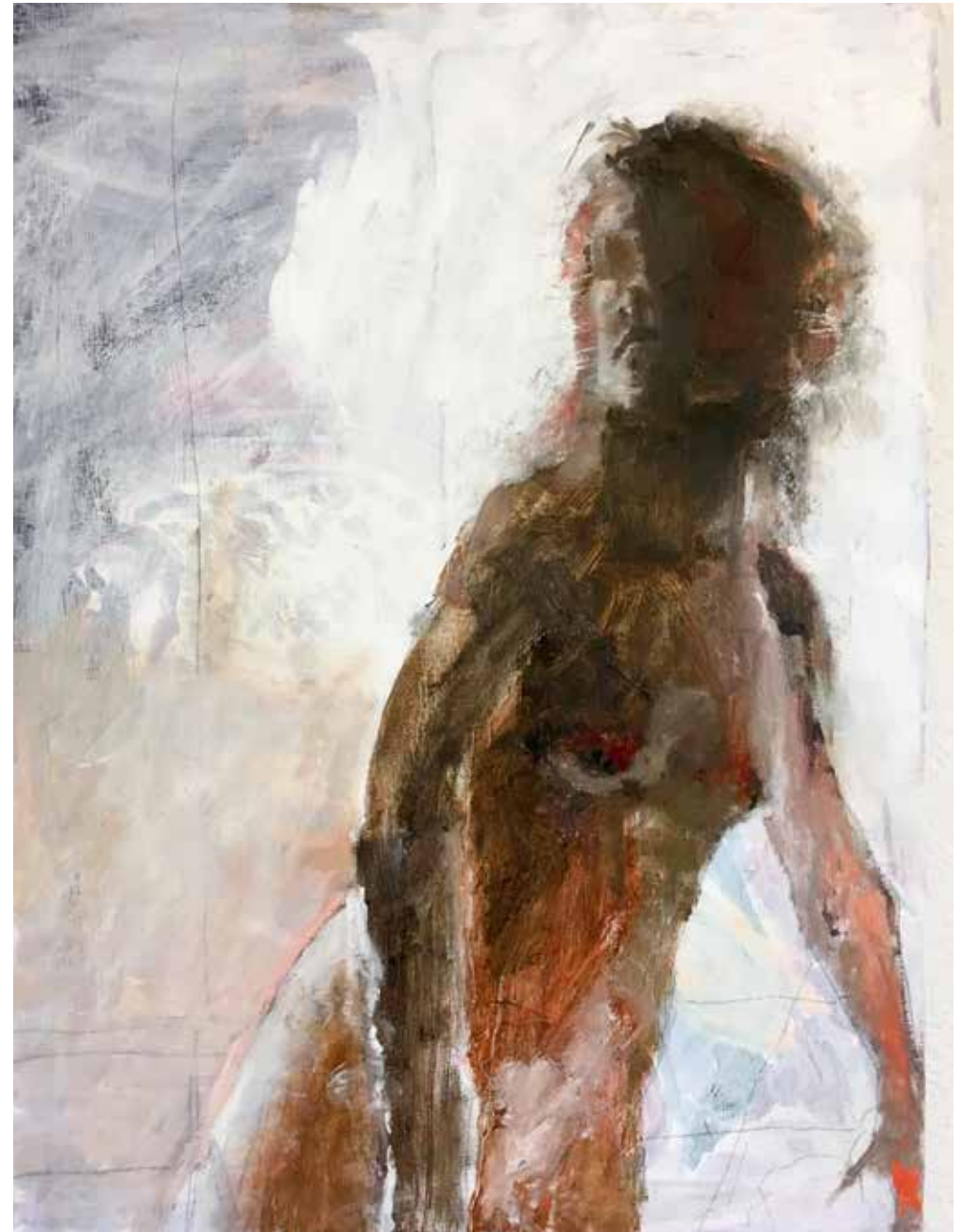
No. 20'105, Öl auf Leinwand, rückseitig signiert, 80 x 60 cm, 2016