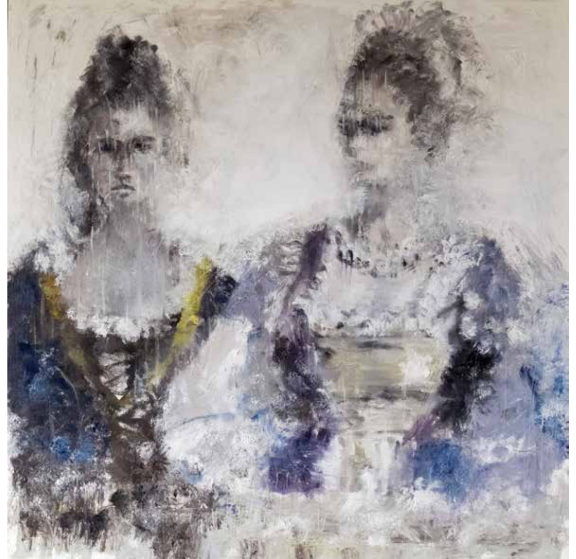
No. 19'664, Öl auf Leinwand, rückseitig signiert, 80 x 80 cm, aus der Werkgruppe „Diva“, 2015