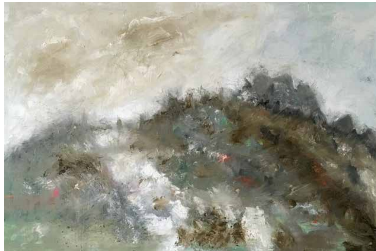
No. 19'857, Öl auf Leinwand, rückseitig signiert, 60 x 90 cm, aus der Werkgruppe „préalpes“, 2016