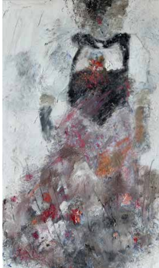
No. 19577, Öl auf Leinwand, rückseitig signiert, 50 x 30 cm, 2015