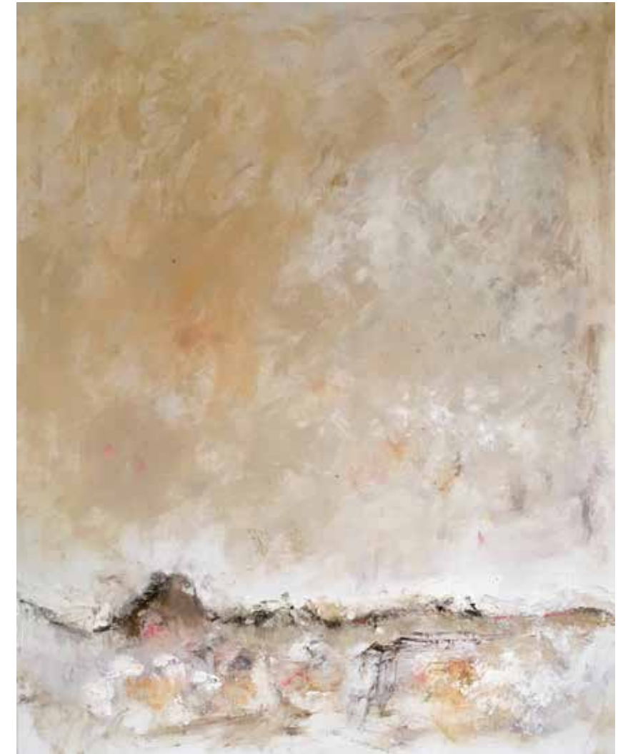
No. 20'156 „Stockhorn“, Öl auf Leinwand, rückseitig signiert, 100 x 80 cm, aus der Werkgruppe „préalpes“, 2017