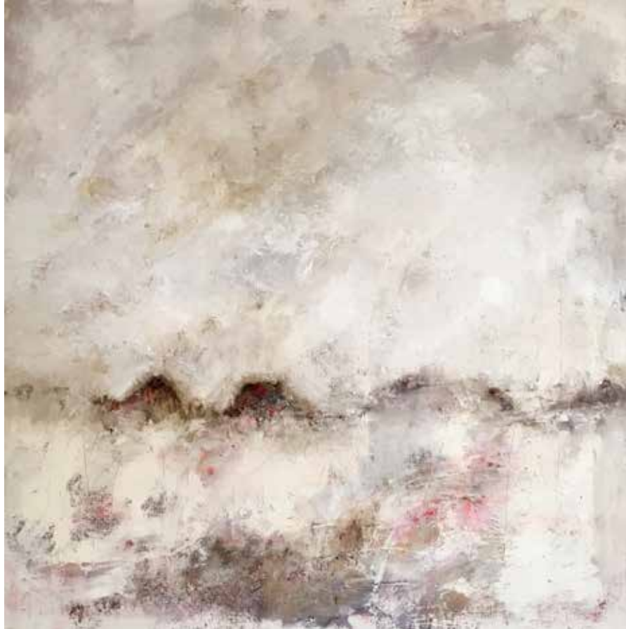
No. 19'543 „Gantrischgruppe“, Öl auf Leinwand, rückseitig signiert, 80 x 80 cm, aus der Werkgruppe „préalpes“, 2016