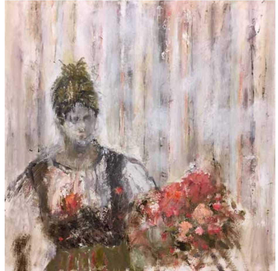
No. 20'144, Öl auf Leinwand, rückseitig signiert, 70 x 70 cm, aus der Werkgruppe „Diva“, 2017