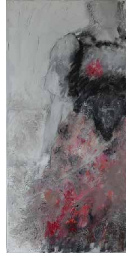
No. 19'575, Öl auf Leinwand, rückseitig signiert, 60 x 30 cm, 2015