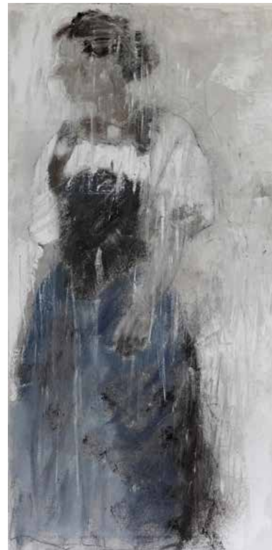
No. 19'589, Öl auf Leinwand, rückseitig signiert, 60 x 30 cm, 2015