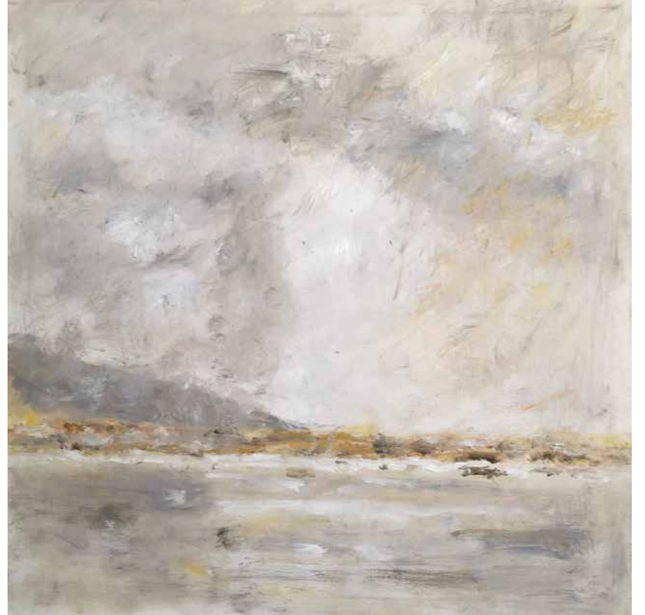
No. 20'040, Öl auf Leinwand, rückseitig signiert, 90 x 90 cm, aus der Werkgruppe „See“, 2016