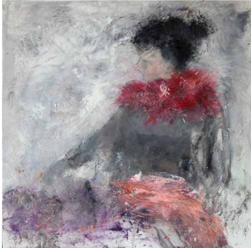
No. 19'716, Öl auf Leinwand, rückseitig signiert, 40 x 40 cm, aus der Werkgruppe „Diva“, 2015