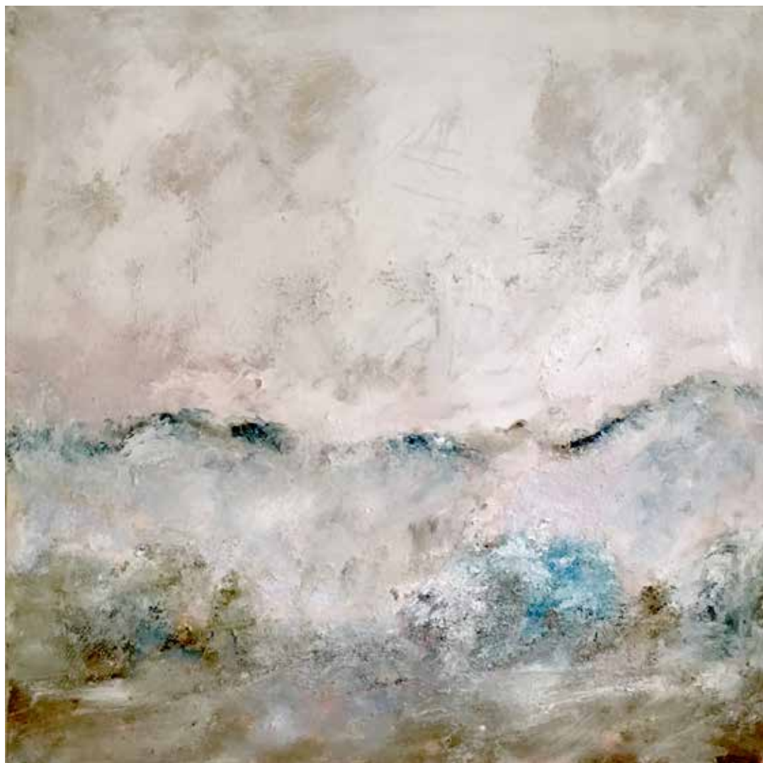
No. 18'714, Öl auf Leinwand, rückseitig signiert, 90 x 90 cm, aus der Werkgruppe „préalpes“, 2016