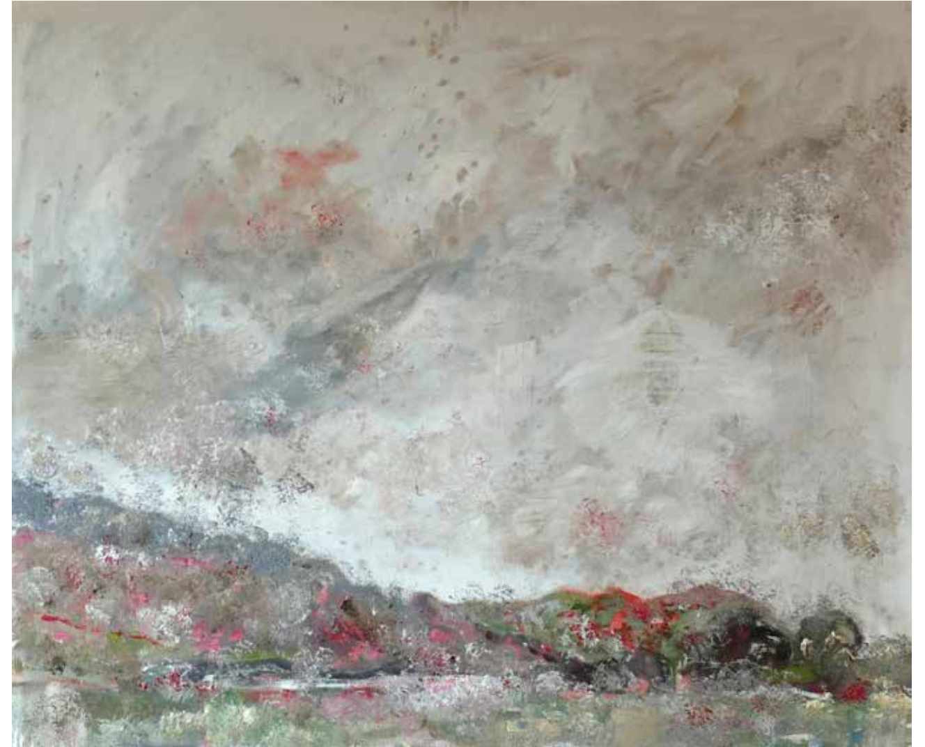
No. 18'872 „Gurnigel“ Öl auf Leinwand, rückseitig signiert, 100 x 120 cm, aus der Werkgruppe „préalpes“, 2013