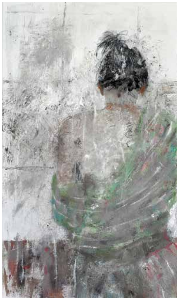
No. 19'580, Öl auf Leinwand, rückseitig signiert, 50 x 30 cm, 2015