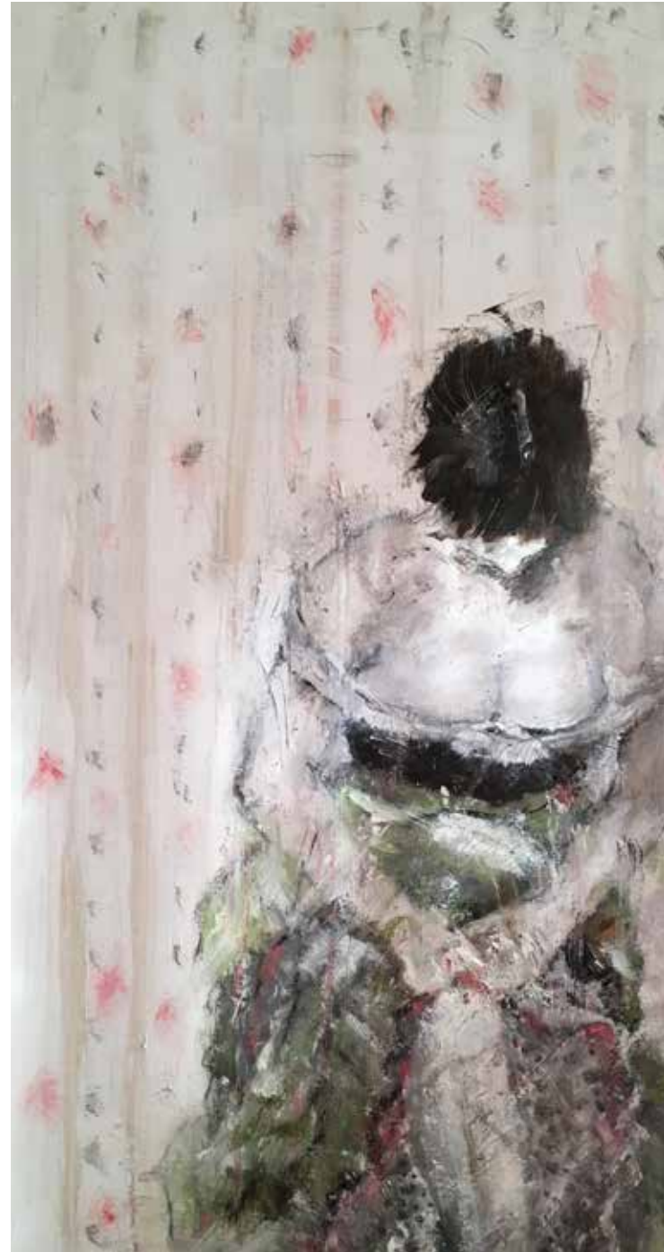
No. 20'100, Öl auf Leinwand, rückseitig signiert, 120 x 60 cm, aus der Werkgruppe „Diva“, 2016