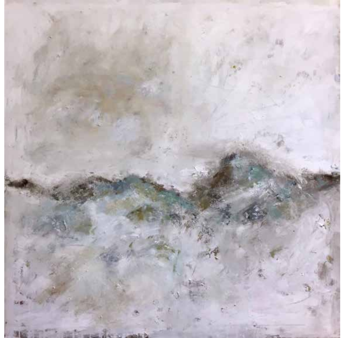
No. 18'234 „Stockhorn“, Öl auf Leinwand, rückseitig signiert, 100 x 100 cm, aus der Werkgruppe „préalpes“, 2017