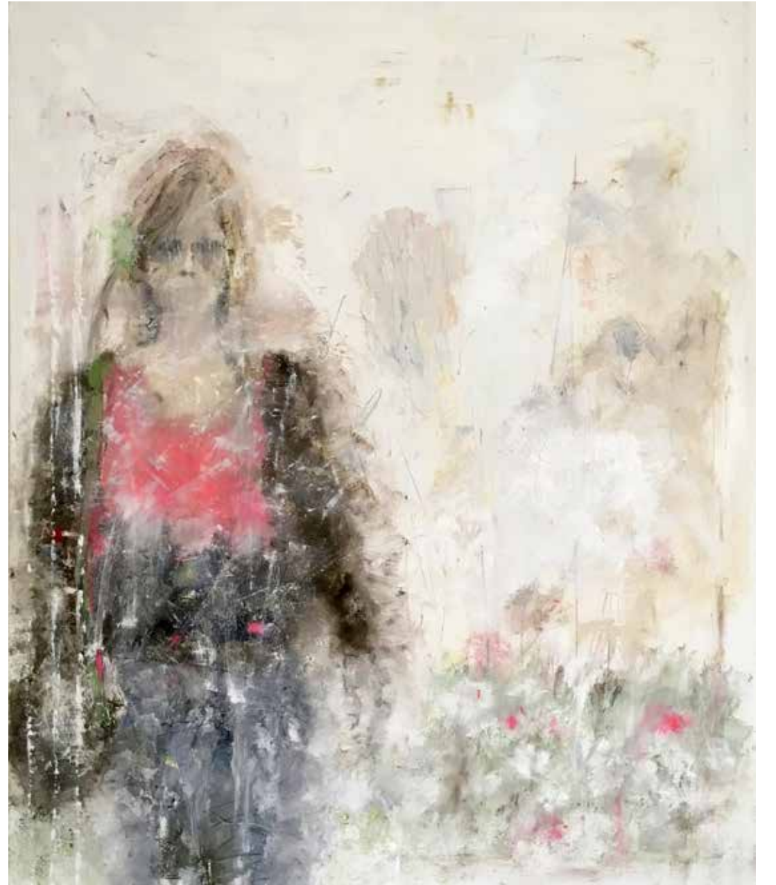
No. 19'145, Öl auf Leinwand, rückseitig signiert, 120 x 100 cm, 2017