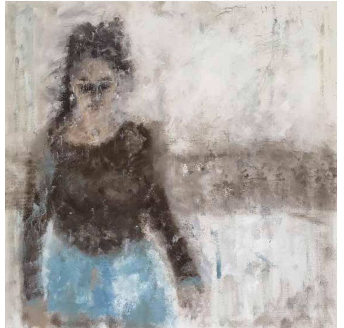
No. 20'162, Öl auf Leinwand, rückseitig signiert, 80 x 80 cm, 2017