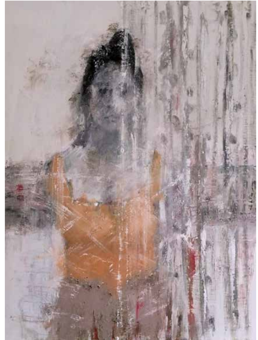
No. 20'150, Öl auf Leinwand, rückseitig signiert, 80 x 60 cm, aus der Werkgruppe „Diva“, 2017