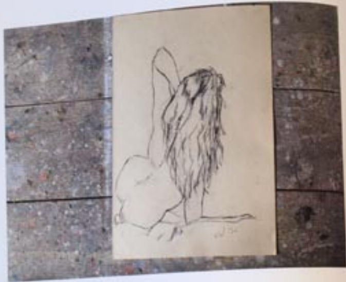
Figure alpha 1976 and 1987